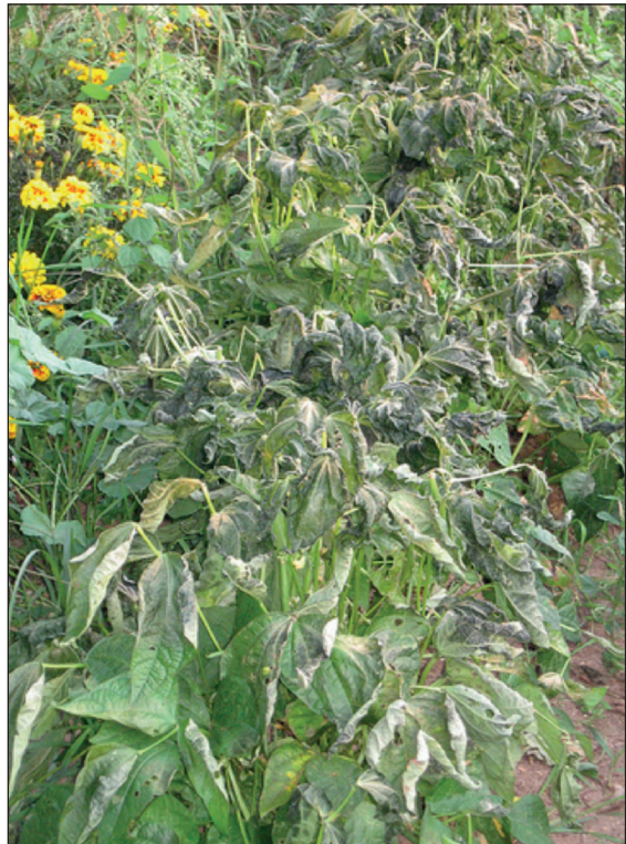
Figura 4.2 | Danni da gelo in fagiolo.

quindi, una continua presenza durante l'anno di prodotto fresco sul mercato. La brevità del suo ciclo produttivo (specialmente nel caso dei tipi nani) può consentire una più agevole introduzione della coltura negli ordinamenti colturali, migliorando l'efficacia agronomica dei relativi avvicendamenti colturali. Per esempio, la coltivazione del fagiolo da industria si è sviluppata soprattutto in semina estiva, dopo la raccolta di un cereale a paglia, per il favorevole andamento termico che si registra generalmente durante la maturazione della granella (settembre). Durante questo periodo le temperature vanno gradualmente diminuendo e ciò favorisce il riempimento dei semi e l'ottenimento di un prodotto di buona qualità, con seme di pezzatura omogenea e con una accentuata colorazione delle screziature.