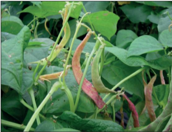
Figura 4.3 | Suscettibilità a cascola fiorale e aborto dei baccelli in fagiolo borlotto.