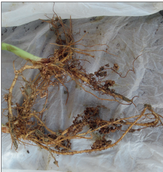
Figura 4.4 | Apparato radicale di fagiolo con elevato livello di nodulazione da batteri simbiotici.

Il processo di formazione comporta profonde modificazioni sia della radice sia del batterio. Le radici, crescendo, secernono nel terreno sostanze che stimolano la moltiplicazione dei batteri. I batteri, a loro volta, elaborano l'acido beta-indolacetico che provoca un caratteristico incurvamento ad uncino del pelo radicale della radice. A questo