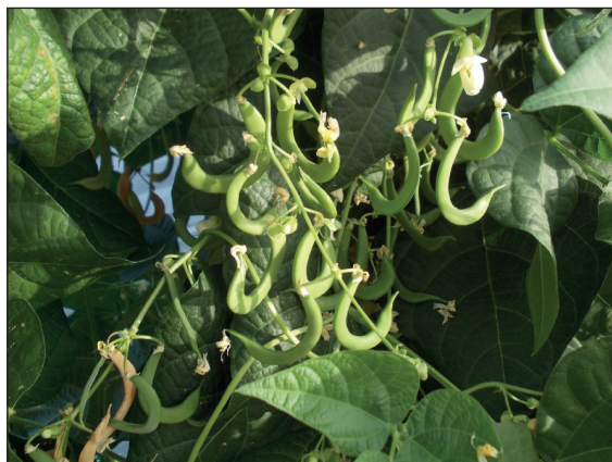
Figura 4.1 | Baccelli uncinati per effetto dell'aborto degli ovuli interni causa temperature elevate.

corto (7-10 giorni): stress idrico ed altre avversità abiotiche risultano molto nocive in questa fase. Le piante indeterminate producono altri nodi dopo l'emissione dei primi fiori, per cui la fioritura può protrarsi fino a 30-40 giorni. Il riempimento dei semi può durare da pochi giorni (piante determinate) a 20-30 giorni (piante indeterminate) e fino ad oltre 50 giorni (piante indeterminate rampicanti). Complessivamente, il ciclo biologico presenta una durata che va da 55 giorni (cultivar determinate, precocissime) a 200 giorni (varietà rampicanti coltivate in montagna).