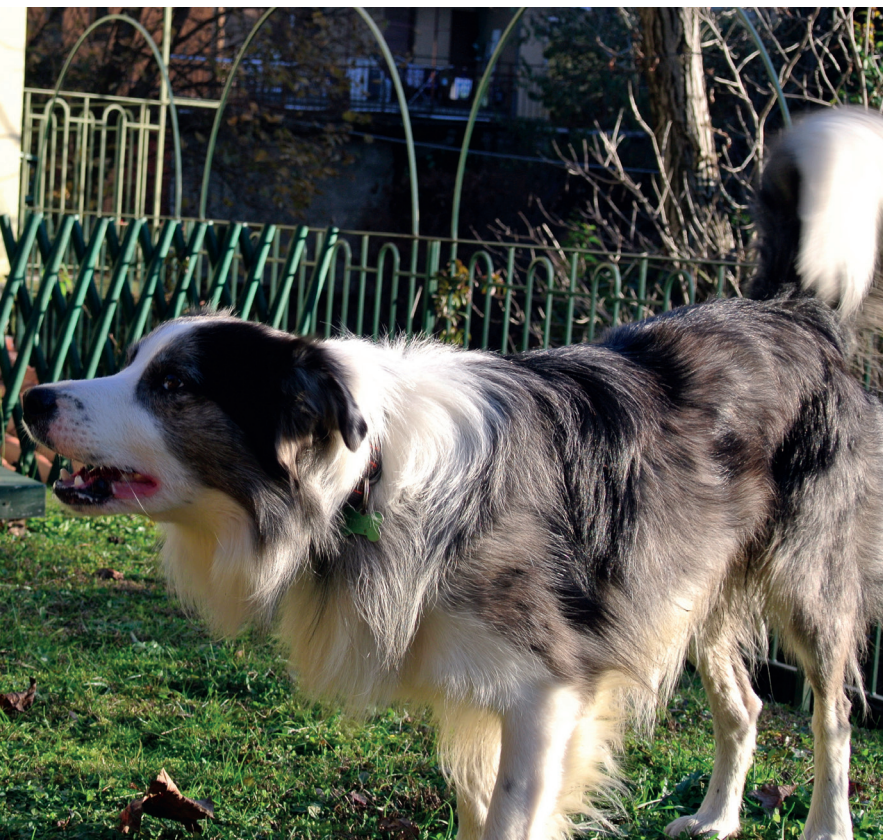
Abbaio protratto in giardino

Il cane che abbaia insistentemente quando viene lasciato da solo in giardino potrebbe avere un problema da separazione, soprattutto se abbaia quando le persone della famiglia non sono in casa, mentre nelle altre situazioni è tranquillo ma chiede spesso di rientrare dopo poco tempo che è uscito. Sarà importante capire se si tratta di un vero e proprio disturbo da separazione oppure di un cane insicuro che si sente più protetto tra le mura di casa. Una visita comportamentale potrà chiarirlo e fornire gli elementi per trovare un rimedio adatto.