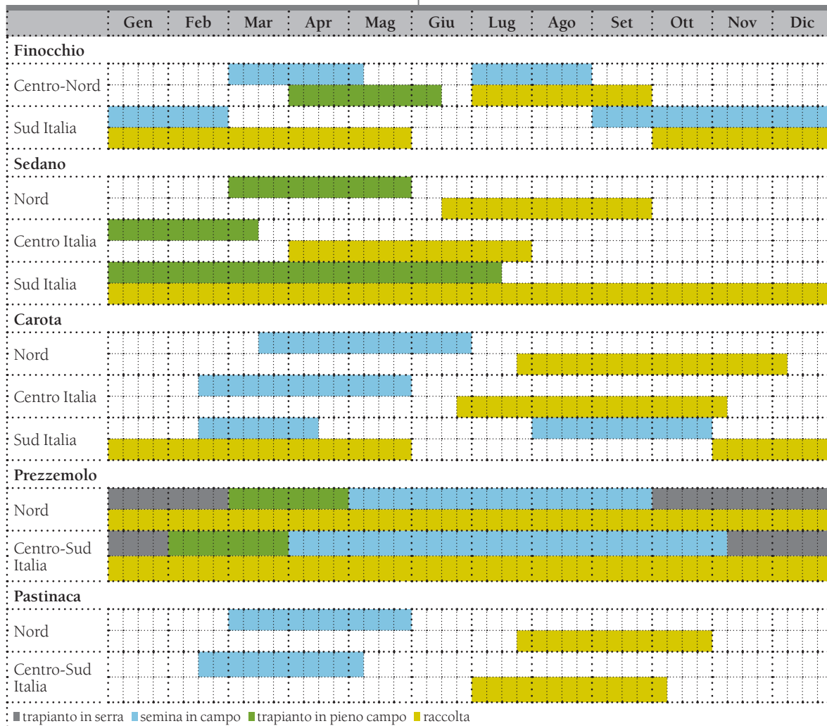
Tabella 13.1 - Calendari di semina, trapianto e raccolta delle più importanti specie orticole della famiglia delle apiacee divise per tipologia e per i macro ambiti produttivi nazionali.

alle latitudini maggiori. Fa eccezione la carota coltivata in Puglia, dove le semine sono effettuate entro agosto per avere prodotto raccolto a marzo per la carota comune (foggiano) e da novembre ad aprile per la raccolta della Carota di Polignano. La produzione è decisamente stagionale, in quanto si concentra nei periodi estivi e autunnali. Tuttavia, a fronte di una sua parallela coltivazione in tunnel e in serra destinata al consumo fresco (commercializzato unitamente alle foglie) è bene sottolineare che questa specie garantisce una conservabilità molto lunga e sufficiente per assecondare il mercato in tutti i periodi dell'anno.