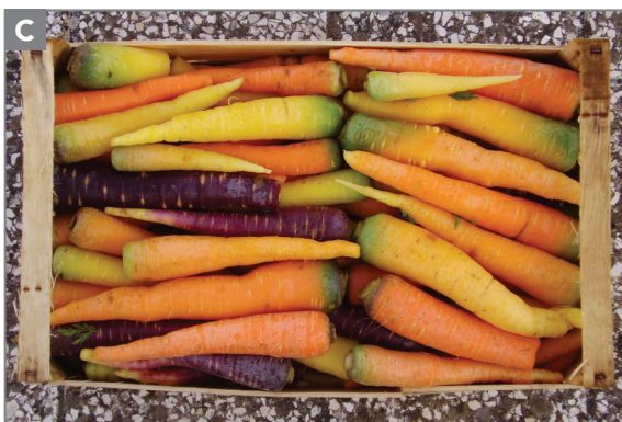
Figura 13.3 - Carota comune (A), di Tiggiano (B) e di Polignano (C).