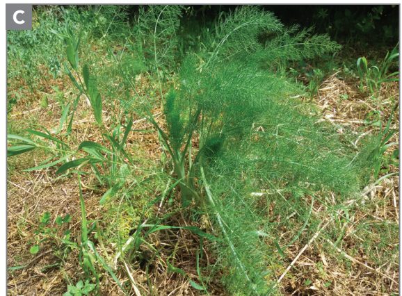
Figura 13.1 - Finocchio (A), crittmo o finocchio marino (B) e finocchietto (C).