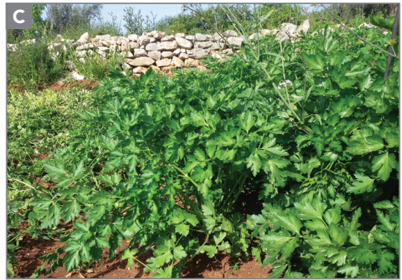
Figura 13.2 - Sedano (A), prezzemolo riccio (B) e prezzemolo liscio (C).